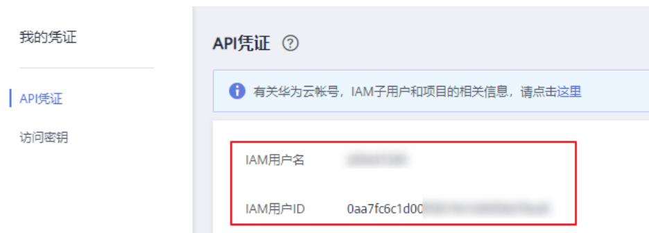
图 19-3 获取用户名和 ID