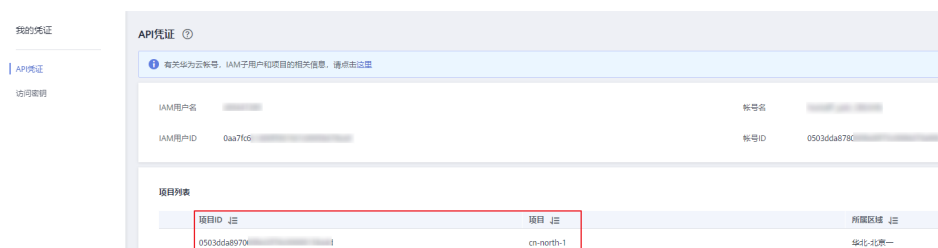
图 19-1 查看项目 ID